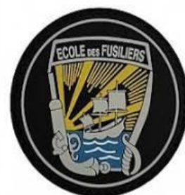
ECOLE DES FUSILIERS MARINS